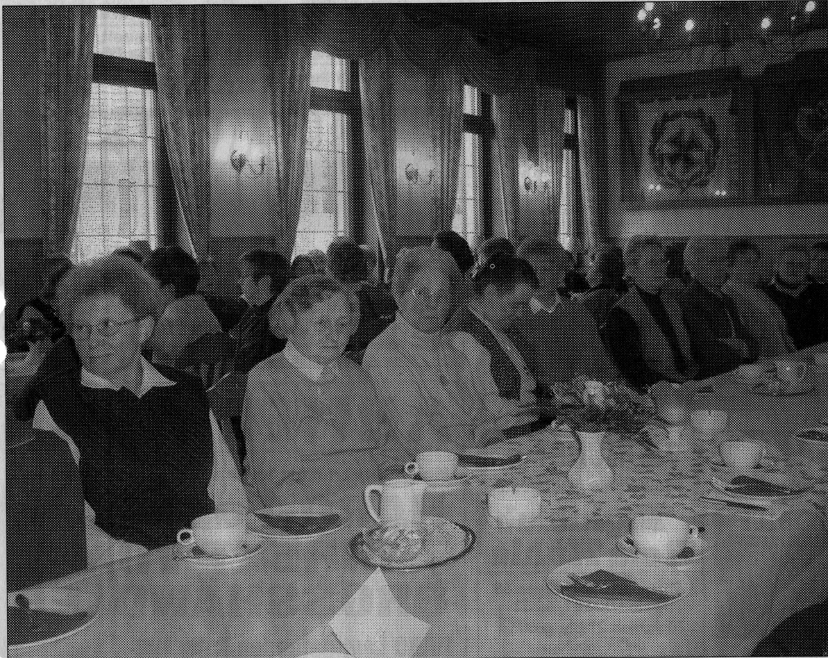
Zahlreiche Landfrauen waren am Mittwoch zur Mitgliederversammlung ihres Verbandes in die Gaststätte Arning gekommen.