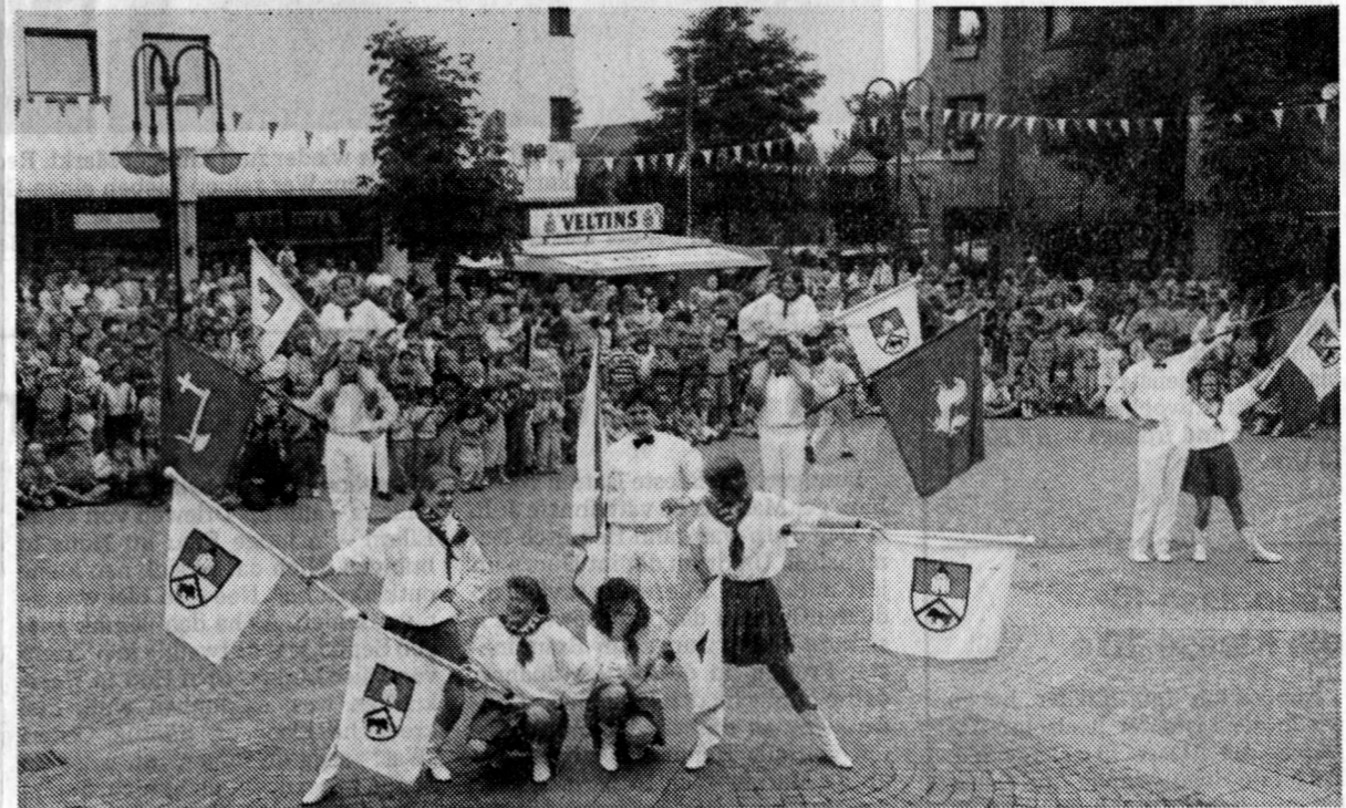
Der Fahenschlag, der von Mitgliedern der Everswinkeler Landjugend vorgeführt wurde, bestach beim diesjährigen Schützenfest besonders, da er mit neuen Fahenschlagbildern angereichert war.