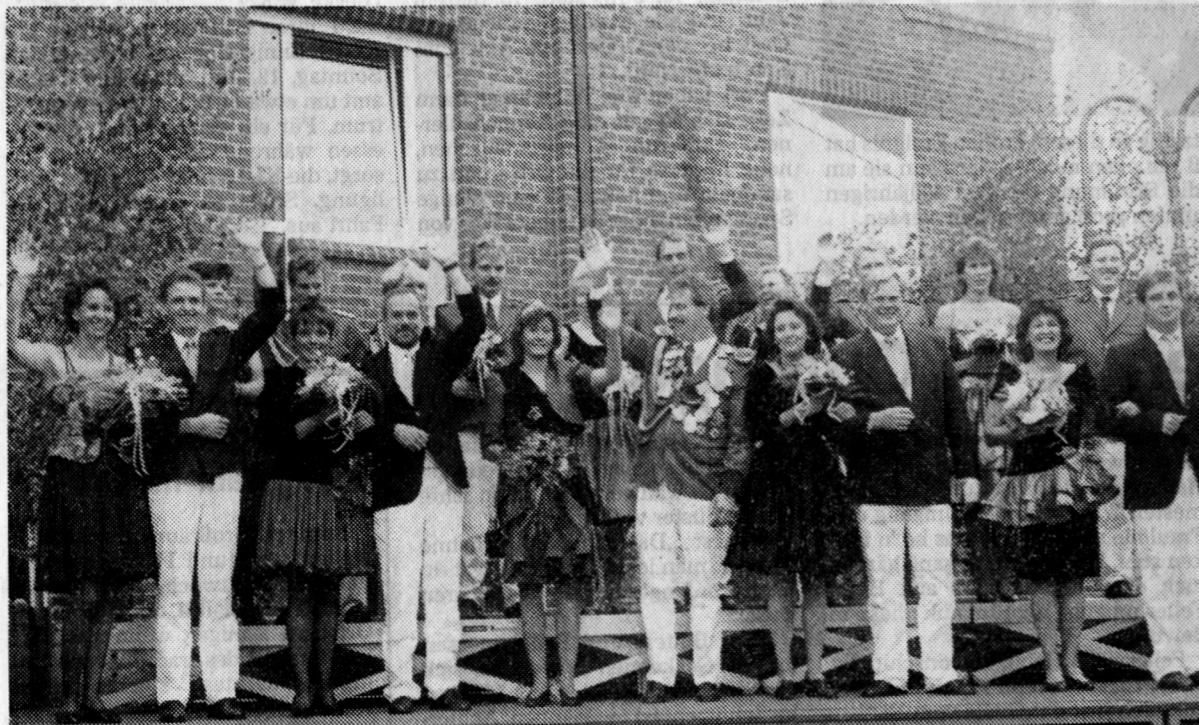
Die Krönung des neuen Regentenpaares, das sich dann mit seinem gesamten Hofstaat dem jubelnden Schützenvolk präsentiert, zieht in Everswinkel immer wieder zahlreiche Zuschauer an.